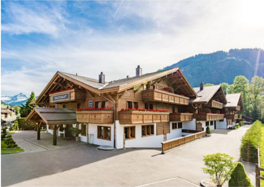
© Ultima Collection Igor Laski | Ultima Gstaad