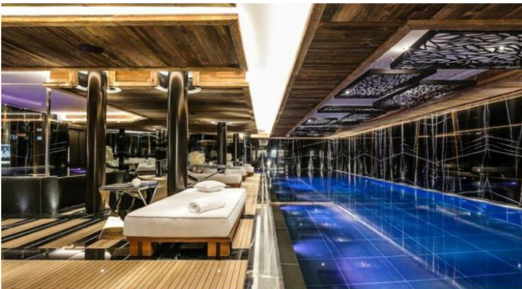
© Bruno Preschesmisky | Ultima Gstaad